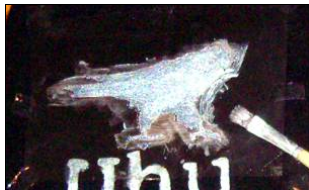
Schablone an den Ecken festkleben und ausmalen